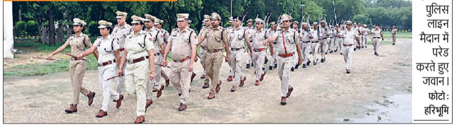
झज्जर। पुलिस लाइन मैदान में परेड करते हुए जवान।

आवश्यक साजो सामान व अन्य जरूरी उपकरण होने चाहिए और पीसीआर, राइडर पर वायरलेस सेट दुर्घटना हालात में होने चाहिए। इसके अलावा सभी गाड़ियों में जीपीएस सिस्टम लगा होना चाहिए गाड़ियों की आगे पीछे रिफ्लेक्टर टेप