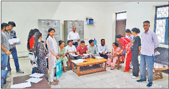
झज्जर | राजकीय स्नातकोत्तर नेहरू महाविद्यालय में दस्तावेजों की जांच करवाते हुए विद्यार्थी।

■ स्नातक कक्षाओं की दूसरी मेरिट लिस्ट का इंतजार हरिभूमि न्यूज़ | झज्जर