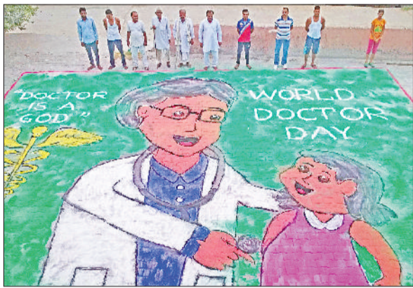
झज्जर। डॉक्टर-डे के उपलक्ष्य में भदना गांव की चौपाल में बनाया रंगोली रेखाचित्र।