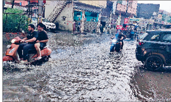
झज्जर। शहर के पुराना बर्फखाना रोड पर जलभराव के बीच गुजरते हुए पाने।

जलभराव के कारण दोपहिया वाहन पानी में बंद हो गए और वाहन चालक पैदल अपने वाहनों को घिसते हुए दिखाई दिए। शहर के माता गेट, सीताराम गेट, अंबेडकर चौक, पुराना तलाव रोड, पुराना बर्फखाना रोड, सिलानी गेट और दिल्ली गेट क्षेत्र सहित अधिकांश जगहों पर बरसाती पानी भर गया।