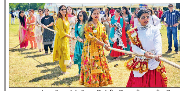
बहादुरगढ़। लंदन में हुए मेले में प्रस्तुति देती हरियाणवी मूल की महिलाएं।