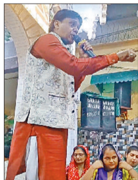
झज्जर। संकीर्तन के दौरान भजन की प्रस्तुति देते हुए गायक कलाकार।