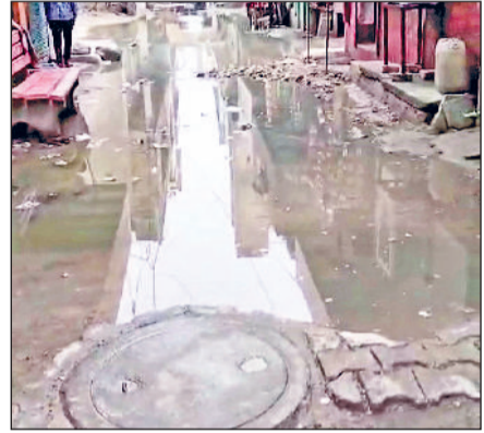
बहादुरगढ़। छोटाराम नगर की गली में भरा सीवर का गंदा पानी।