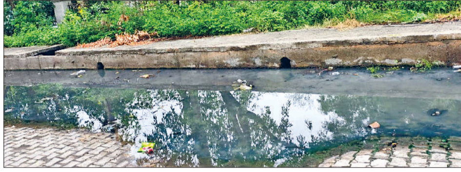
बहादुरगढ़। दिल्ली रोहतक रोड पर गौरेया पर्यटन केंद्र के बाहर जमा गंद पानी।

मानूसन ने भले बारिश से शहर को अभी तक न भिगोया हो, लेकिन दूषित जल और गंदगी से लोग बीमार पड़ना शुरू हो गए हैं। मलिन बस्तियों में डायरिया, पीलिया और टायफाइड के पीड़ित मिलने लगे हैं। सड़कों पर कई जगह पानी भरा हुआ है। जिसकी वजह से लोगों को निकलने में भी परेशानी होती है। जलभराव की वजह से बीमारियां फैलने की आशंका बनी हुई है। जलभराव