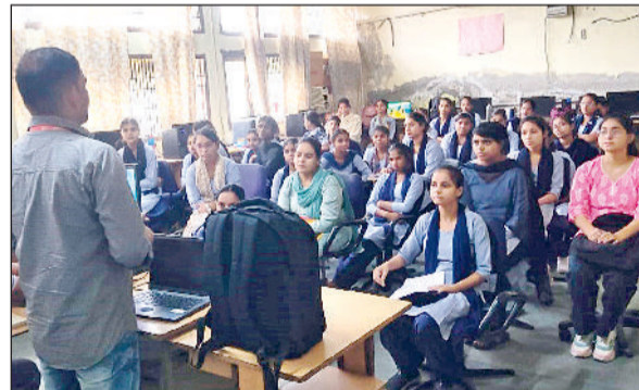
बहादुरगढ़। प्री प्लेसमेंट मेले में भाग लेती महिला आईटीआई की छात्राएं।