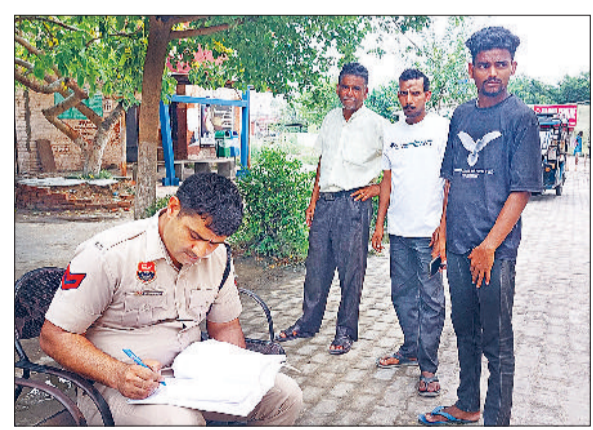
झज्जर। नागरिक अस्पताल परिसर में कामजी कारवाई करते हुए पुलिसकर्मी।

जिसके बाद लगातार उसकी तलाश की जा रही थी। पुलिस द्वारा शिनाख्त कराने के बाद शव परिजनों को सौंप दिया गया है। इस संबंध में नियमानुसार आगामी कारवाई अमल में लाई जा रही है। बता दें कि बीती 28 जून को अकेहड़ी मदनपुर पंप हाउस से शव बरामद हुआ था। कर्मचारियों द्वारा सूचना दिए जाने उपरांत पुलिस ने मौके पर पहुंच कर कर्मचारियों की सहायता से शव को पानी से बाहर निकलवाया और शिनाख्त के लिए स्थानीय नागरिक अस्पताल के शवगृह में आगामी 72 घंटों के लिए रखवा दिया था।