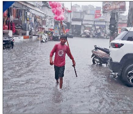
झज्जर। बरसात के दौरान हुए जलभराव के बीच गुजरते हुए राहगीर।